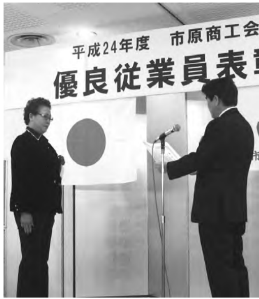
榊原会頭(右)から賞状を受け取る被表彰者

11月28日(水)、市原市市民会館にて、優良従業員表彰式を開催した。会員企業33事業所より推薦された計84名の方々に表彰し、その労を讃えた。 榊原会頭は表彰者の今後の活躍と健勝を祈念し、又、表彰者家族の皆様へ感謝の意を表し祝福の言葉で結んだ。