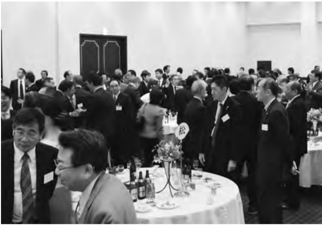
五井グランドホテルにて大勢の来場者が新年を祝った

「今年も、地域と企業の連携、情報発信により市原の魅力を向上させながら、実のある事業を展開し、市原が元気になるために底辺で支えていきたい。」と抱負を語った。